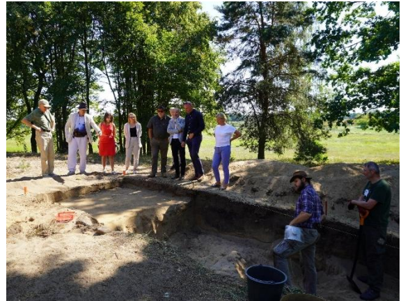
2 Spotkanie dotyczące odkryć na Łysej Górze – 27 sierpnia 2024 r.

16 września 2024 r., po pierwszym sezonie wykopalisk, w siedzibie Urzędu Miasta i Gminy w Chorzelach, jak i na samym stanowisku, odbyła się konferencja prasowa poświęcona sensacyjnym znaleziskom. Na kilka tygodni przed konferencją, o odkryciach archeologów można było przeczytać niemalże na wszystkich polskich portalach informacyjnych, usłyszeć w radiu czy telewizji. Odnaleziony podczas sierpniowych wykopalisk celtycki hełm stał się ikoną Łysej Góry, a jego zdjęcie towarzyszyło nagłówkom w światowych periodykach takich jak: Newsweek, Live Science, Miami Herald, Smithsonian Magazine, Science&Vie, Design Times, Archeology Magazine i wielu, wielu innych.