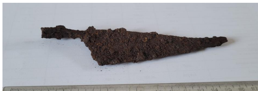
1 Część zabytków odkrytych na Łysej Górze podczas wykopalisk w 2024 r.