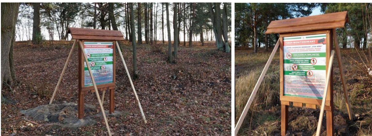
5 Tablice informujące m.in. o monitoringu na Łysej Górze, fot. UMIG w Chorzelach

Wiadomo już, że PMA będzie kontynuowało swoje badania nad stanowiskiem również w kolejnych latach. W sierpniu br. planowany jest drugi sezon wykopalisk. W tym momencie naszym priorytetem jest ochrona i zabezpieczenie stanowiska, dlatego też na terenie Łysej Góry został zamontowany całodobowy monitoring oraz tablice o nim informujące.