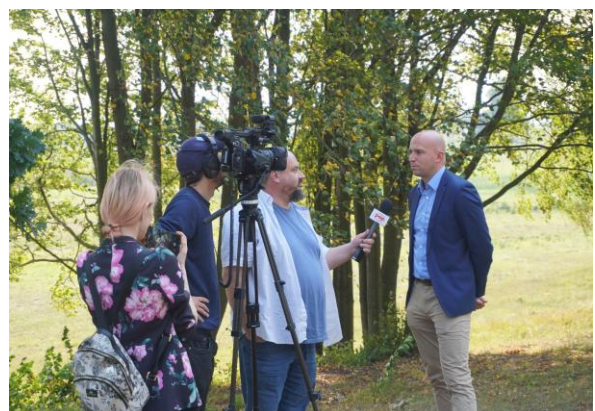
3 Konferencja prasowa 16 września 2024 r.