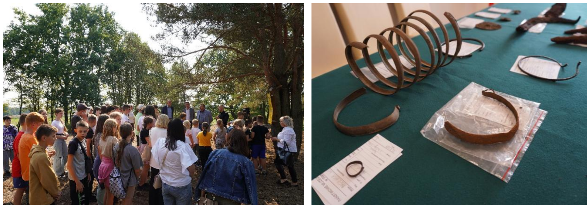
4 Konferencja prasowa 16 września 2024 r. – zabytki odnalezione na Łysej Górze i uczniowie PSP w Krzynowłodze Wielkiej – lekcja terenowa na stanowisku

Ogromne zainteresowanie tematem przełożyło się również na szereg licznych zapytań o znaleziska, badania, i historię samego stanowiska, przez co mieliśmy okazję gościć w Chorzelach dziennikarzy i przedstawicieli mediów.