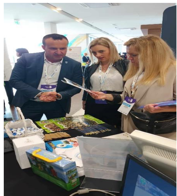
5) Nowoczesna Metoda Nauczania Matematyki – organizator Uczelnia Lingwistyczno-Techniczna z Przasnysza.