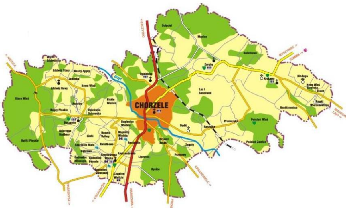
Rysunek 2. Mapa gminy Chorzele.

Gmina charakteryzuje się dogodnym położeniem komunikacyjnym. Droga krajowa nr 57, jest najkrótszą drogą prowadzącą z Warszawy na Mazury, co niewątpliwie pozytywnie wpływa na rozwój gminy i pozyskanie nowych inwestorów oraz mieszkańców. Ponadto przez teren gminy przebiegają dwie drogi wojewódzkie: nr 616 oraz nr 614. Pierwsza z nich łączy Chorzele z Gruduskiem i Ciechanowem. Droga nr 614 łączy natomiast siedzibę władz gminy z Myszyniecm oraz zapewnia dogodny szlak komunikacyjny łączący Polskę z Litwą.